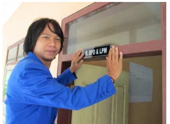
Pasang Baner Arah