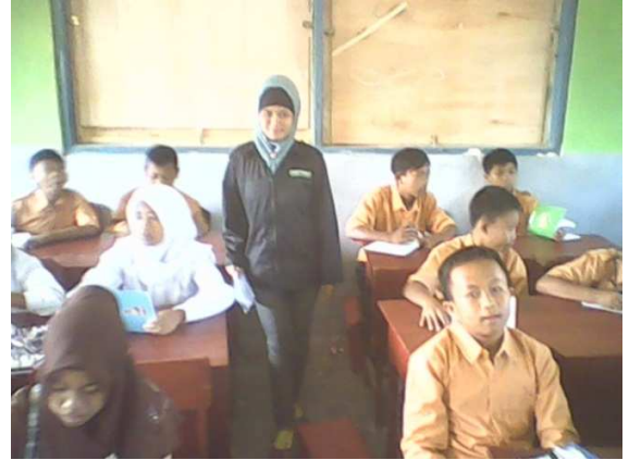
Membantu KBM di MTS Darun Najah